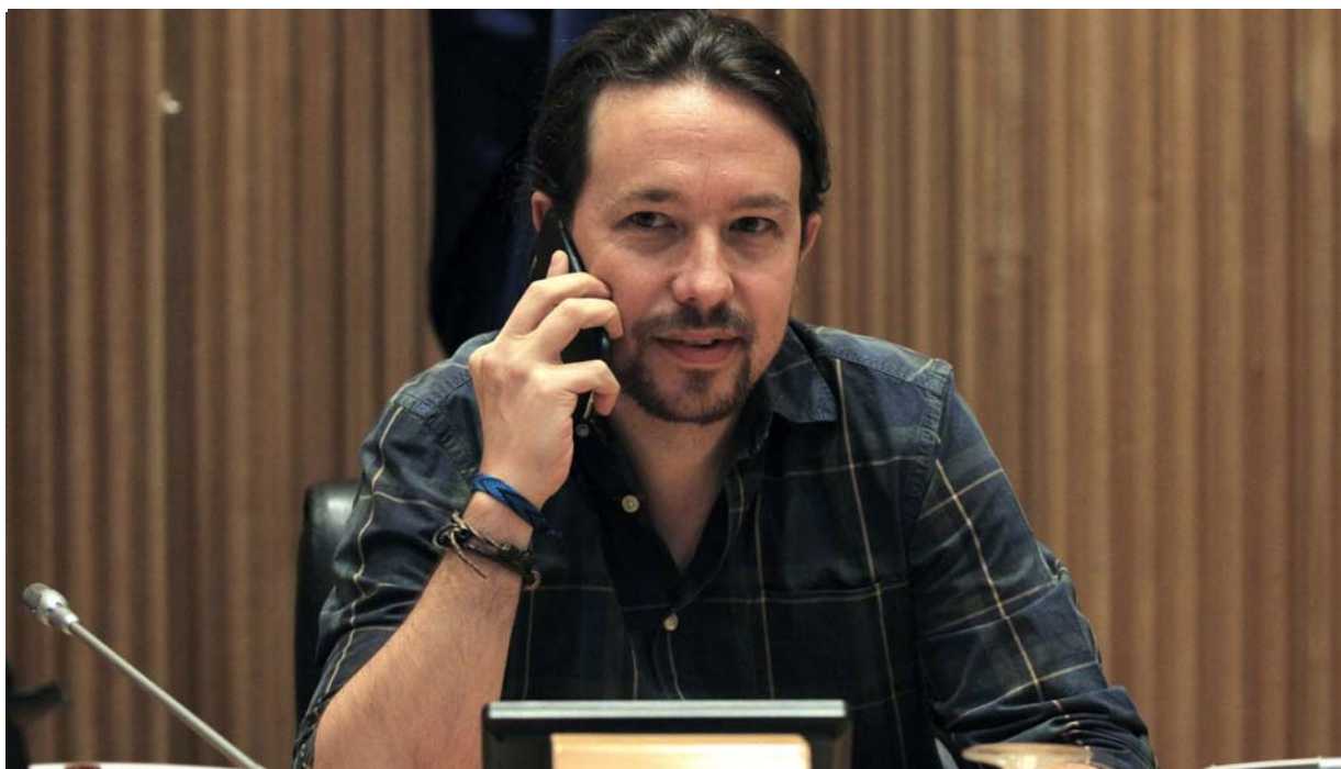
El líder de Podemos, Pablo Iglesias, en el Congreso de los Diputados.

Ante el espectáculo del golpe parlamentario y la convocatoria del referéndum del sí o sí , ambas cosas aderezadas con el aplastamiento de los constitucionalistas, Pablo Iglesias tuvo la ocasión de demostrar que su radicalismo se detenía ante el asalto a la democracia. La desperdió conscientemente, al lanzar el grito de "viva a la Catalunya libre y soberana" y disfrazar como Ada Colau el plebiscito de "movilización" . Al igual que la alcaldesa, había encubierto la baza previamente elegida: hacer remilgos y acabar defendiendo el sí. Luego la protesta contra el supuesto el Estado de excepción –así llama a hacer cumplir la ley–, fue la llave para salir del