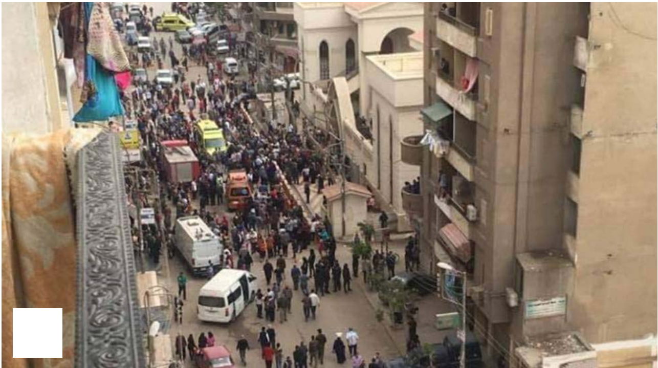
Alrededores de la iglesia atacada. @CONVEY

Al menos 21 personas han muerto y otras 59 han resultado heridas como consecuencia de una explosión registrada este domingo mientras se celebraba una misa en la iglesia copta de San Jorge, en la localidad egipcia de Tanta , en el delta del Nilo, a 120 kilómetros al norte de El Cairo , según ha confirmado en un comunicado el Ministerio de Sanidad de Egipto. El atentado se ha producido justo antes del inicio de las celebraciones del Domingo de Ramos, comienzo de la Semana Santa cristiana.