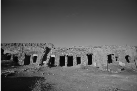
El convento de San Elías, en Mosul, en una fotografía tomada el 7 de noviembre de 2008.

Fotografías de satélite obtenidas por Associated Press confirman lo que líderes religiosos y expertos en antigüedades se temían: el monasterio cristiano más antiguo de Irak ha sido reducido a escombros por el autodenominado Estado Islámico (ISIS, en sus siglas en inglés).