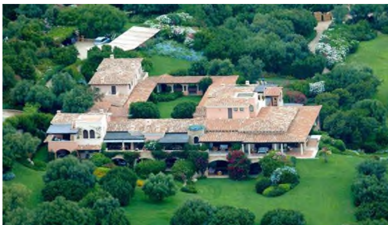
Vista aérea de villa Certosa, la mansión de Silvio Berlusconi en Cerdeña.

Archivado en: Desigualdad económica | Credit Suisse | Desigualdad social | Economía | Sociedad