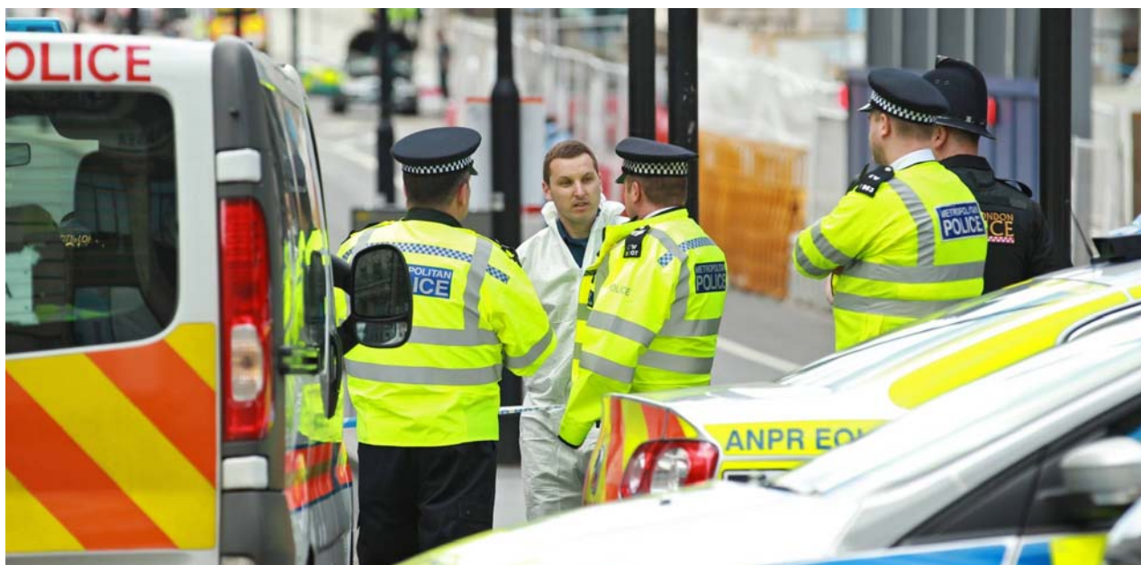
La policía bloquea el puente de Londres tras el atentado

En su llamamiento a la resistencia islámica global, a principios de 2005, el luego desaparecido Mustafá Setmarián explicó las ventajas del método conocido ya como actuación de lobos solitarios, los cuales, solos o en compañía de unos pocos hombres y amigos unidos por la ideología y por la confianza recíproca, ejecutan los atentados. "Abre la posibilidad de incorporar a la yihad a cientos de miles de musulmanes fieles a la causa islámica" (Setmarián). No exige una estructura organizativa, expuesta por ello al riesgo de ser detectada, y sin embargo puede ser presentado, tal y como ocurre con la cascada de últimos atentados, en nombre de una organización o de aspiraciones de alcance global.